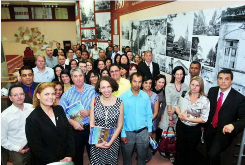
Os estudantes também conheceram o Centro de Memória, Arquivo e Cultura (CMAC) do Tribunal, na Sede Administrativa da Corte, no Centro de Campinas